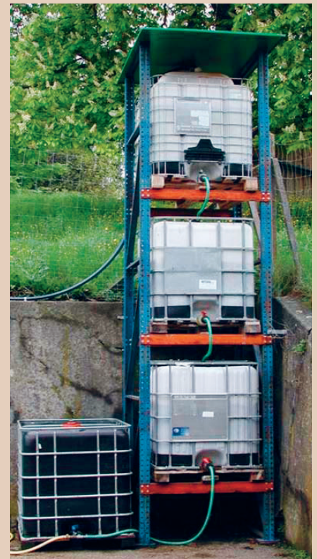
Le système de biofiltre est intéressant, si on utilise l'eau filtrée pour l'arrosage, AGRIDEA