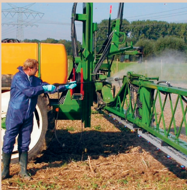
Nettoyage d'un pulvérisateur sur la parcelle, TOPPS

Lors du remplissage et du nettoyage des pulvérisateurs pour les grandes cultures ou les cultures spéciales, il existe un risque de contamination des eaux de surface par les produits phytosanitaires (PPh) concentrés ou par les eaux de lavage (entrées ponctuelles). Cette fiche thématique donne un aperçu des différentes possibilités de remplissage et de nettoyage corrects des pulvérisateurs et de traitement des eaux de lavage. Elle propose aux exploitations agricoles quatre étapes leur permettant de trouver la solution la plus adaptée.