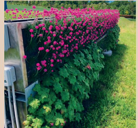
Le système VG Biobed™ occupe peu de surface au sol. Installation à Bernex GE, ecaVert

Installation de référence : Luc Magnollay, 1163 Etoy VD, culture fruitière, capacité 10 m 3 /an