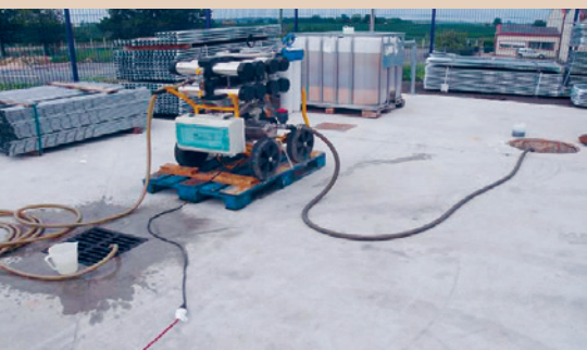
L'installation d'ultrafiltration permet de traiter de grandes quantités d'eau de lavage, CCD