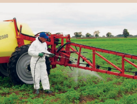
Nettoyage d'un pulvérisateur agricole à l'aide d'un jet haute pression, TOPPS