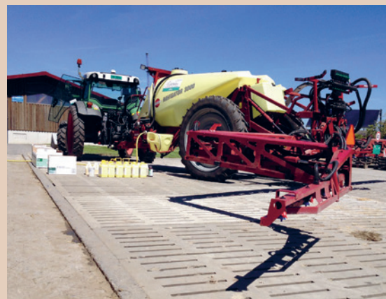
Nettoyage d'un pulvérisateur sur un site disposant d'un écoulement vers une fosse à purin active, St. Berger