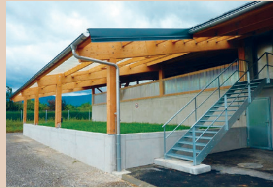
Biobac de l'installation collective de Dardagny, AGRIDEA

Utilité : pour un nombre restreint de lavages ou le nettoyage annuel du pulvérisateur avant l'hivernage.