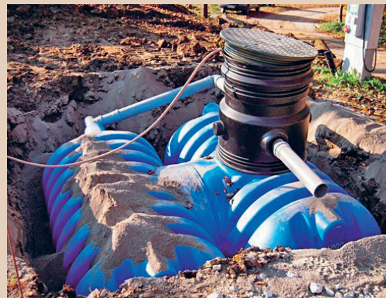
Une cuve de rétention enterrée est à l'abri du gel, mais elle doit impérativement être équipée de doubles parois, L. Chevalier

Fosses à purin inutilisées: une fosse à purin qui n'est plus utilisée est en général verrouillée et il n'est pas permis d'y entreposer de l'eau de rinçage. Elle ne satisfait pas aux prescriptions légales réglant le stockage des liquides pouvant altérer les eaux (double paroi).