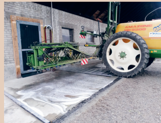
Poste de nettoyage aménagé sous un avant-toit avec grille de drainage, Th. Haller