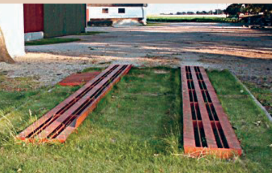
Les machines sont positionnées sur les bandes de roulement connectées directement au système Biobed et cela ne nécessite pas de poste de remplissage et de nettoyage séparé, M. Castillo

Tous les systèmes de traitement biologiques comme Biobed, Biobac, etc., sont basés sur l'évaporation et la dégradation des résidus de PPh par des micro-organismes. Ces systèmes sont composés d'un bac rempli de substrat sur lequel est épandue l'eau de lavage. Pour empêcher la pénétration de l'eau de pluie, le bac devrait être couvert. Les micro-organismes ont besoin d'un milieu aérobie. L'eau de rinçage doit donc être déversée de manière contrôlée et les excédents éventuels reversés ultérieurement dans le bac. Un substrat enherbé permet d'augmenter la capacité d'évaporation. Les résidus d'herbicides peuvent altérer l'enherbement et réduire l'efficacité du système. Les PPh à base de métaux lourds (cuivre) ne peuvent pas être dégradés par les micro-organismes et peuvent s'accumuler dans le substrat. En cas d'utilisation fréquente de cuivre, il peut être nécessaire de recourir à un filtre à cuivre, sinon le substrat risque de finir par devoir être éliminé avec les déchets spéciaux. Le substrat doit être remplacé après un certain temps d'utilisation. Le substrat usagé doit alors être épandu sur une grande surface dans la SAU.