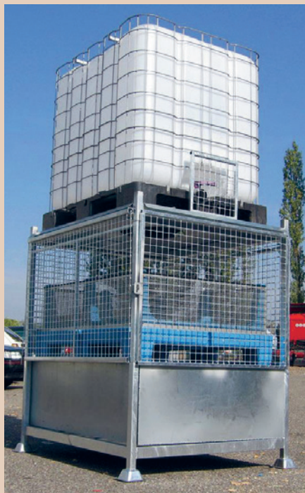
Le fonctionnement du système Osmofilm est purement physique, raison pour laquelle les résidus doivent être éliminés, CCD