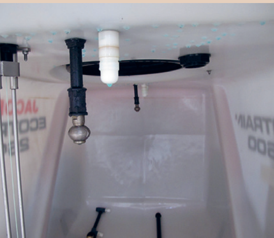
Cuve de pulvérisateur avec buse de rinçage intérieure, agrotop