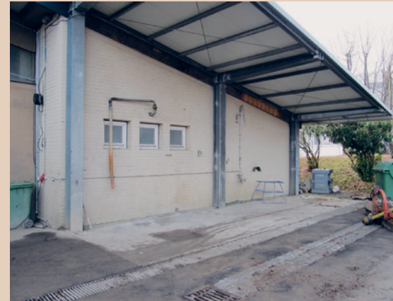
Poste de remplissage du pulvérisateur avec potences et grilles de drainage à Bavendorf (D), B. Arnold

Utilité : pour des exploitations devant souvent remplir et nettoyer le pulvérisateur.