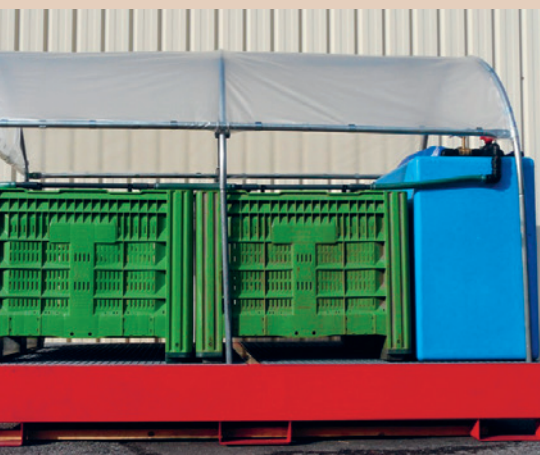
Le système Biobac® : il existe de nombreux modèles et tailles différentes. Ici, une installation mobile de CCD