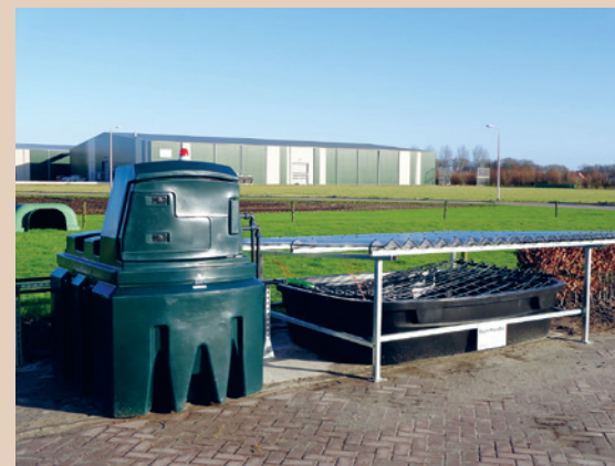
Le système Phytobac® est modulable, Beutech Agro