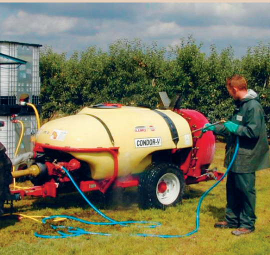
Nettoyage d'un turbodiffuseur sur une surface enherbée, TOPPS

Amélioration d'un poste existant: la place est souvent l'élément le plus cher de l'installation. Beaucoup d'exploitations, d'entreprises de travaux agricoles, etc., disposent de postes de lavage pour le rinçage des machines ou de places couvertes sous des avant-toits, des hangars à machines, etc. Il est possible d'étudier l'aménagement de tels postes demandant un minimum de travaux pour le nettoyage des pulvérisateurs. Les exigences peuvent varier en fonction des cantons (toit, séparation des eaux de pluie, etc.). Il conviendrait donc de consulter le service cantonal compétent (service de la protection des eaux) dès le stade de la planification.