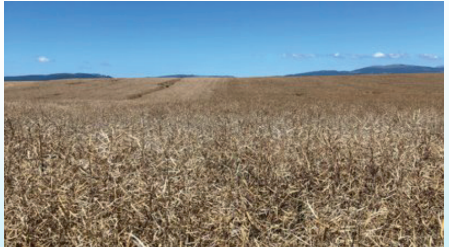
Echallens (VD): Schotenplatzfestigkeit der Sorte DK EX LIBRIS Links: Vergleichssorte / Rechts: DK EX LIBRIS Nach einem Hagelschlag im Juli 2022